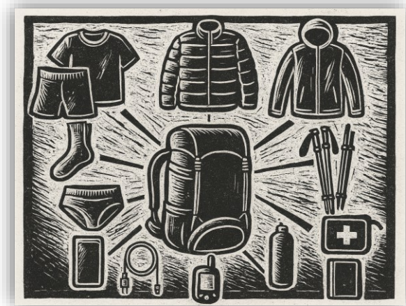
תרשים הציוד שלי